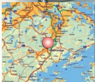
● Jordbro Företagspark