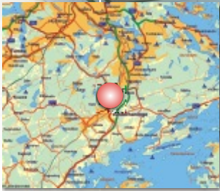
Jordbro Industrial Park